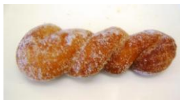
ツイストドーナツ (シュガー) ¥100