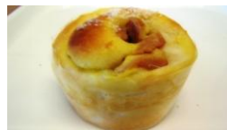
ソーセージドーム ¥140