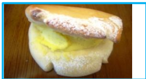
幻のクリームパン ¥130