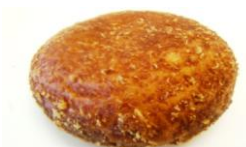
とろ〜りカレーパン ¥170