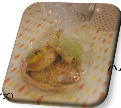
¥230- 小亀パン、 プチ鳴門金時芋、 ハムチーズパン(1/2サイズ)