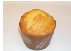
マフィン (チョコ・プレーン) ¥100