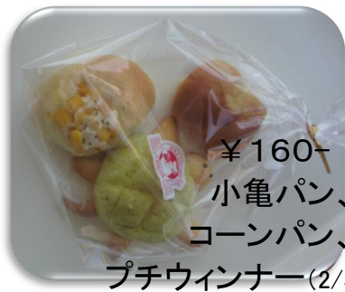
¥160- 小亀パン、 コーンパン、 プチウインナー(2/3サイズ)